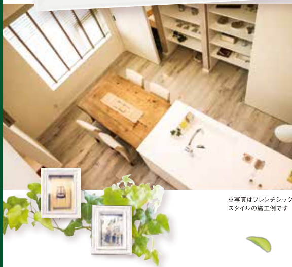
※写真はフレンチシック スタイルの施工例です

MODEL HOUSE GRAND OPEN! French Chic Style