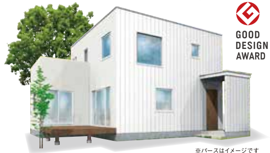
※パースはイメージです